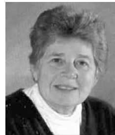
Д-р Хулда Кларк

В резултат на продължителни изследвания американският микробиолог-клинист Хулда Кларк през 80-те години на 20-ти век преоткрива забравената идея на д-р Райф, като по опитен път намира честотата, която влияе на биохимичните процеси в клетката предизвикваща метаболитен блок - спира клетъчното дишане на болестотворните паразити.