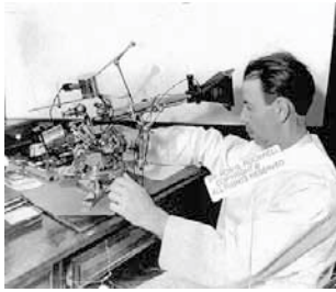
Д-р Роял Райф

Известно е, че всяка клетка и всичко, което има температура по-висока от 0 °С има своя честота на трептене. Зарегистриран е диапазон на честотите на повече от 150 000 паразитни форми – вируси, бактерии, микози и паразити. Това откритие на д-р Роял Реймънд Райф през 30-те години на 20-ти век е позволило да се разработят нови методи за диагностика и лечение. В неговата основа е обективния физичен процес, наречен резонанс. Методът на д-р Райф позволява да се унищожават само патогените, без да се засягат здравите клетки и тъкани.